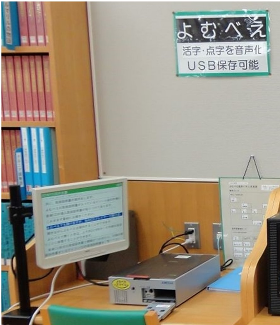
よむべえスマート