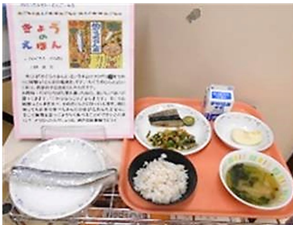
本に出てくる料理を給食メニューに