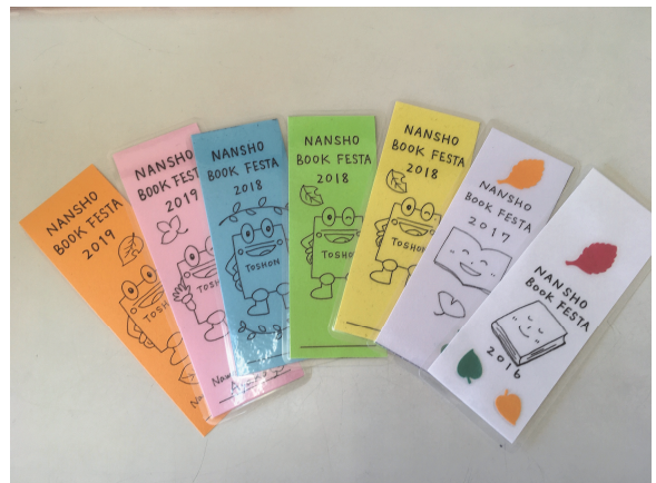
しおり：平成30年からトシヨ登場