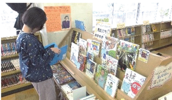
先生おすすめの1冊