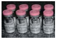
大阪微生物病研究会によってGMP生産されたSE36マラリアワクチン治療薬

従来の化学療法では効果のなかった感染症に対して化学療法と生体の免疫反応を組み合わせた新しい感染症の治療方法を確立し、耐性菌がでにくい治療法の開発や化学療法薬の効力を増すワクチン技術の開発をしました。