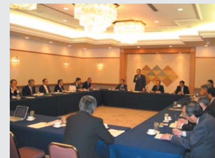
静岡県科学技術コーディネータネットワーク会議 (県内の産学官連携プロジェクトを推進するコーディネータが一堂に)