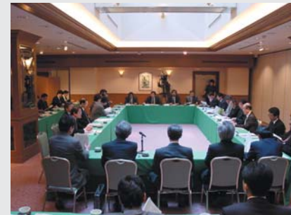
北海道ITクラスター協議会 (地域の経済界、大学、自治体等と両省が事業の推進等について協議)