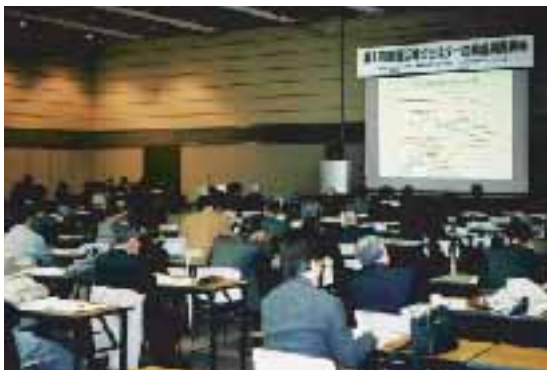
写真1 第1回関西広域クラスター合同成果発表会