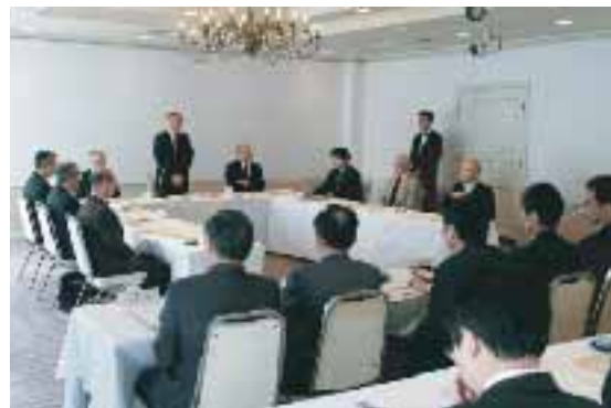
写真2 希少糖プロジェクト戦略委員会 (知事、大学長、経済界代表、経済産業局長等が一堂に)