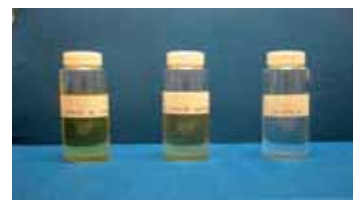
生体適合塗布材料