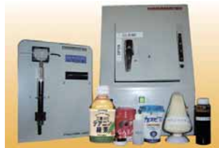
研究成果の一部(試作品、開発品を含む)

また、地域大学が有する糖鎖関連研究を発展させ診断薬等の化成品分野のビジネス創出にも寄与する。