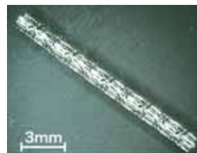
狭心症治療用ステント

都市エリア産学官連携促進事業(一般型)で培ってきた超高精度加工技術はQOL(Quality Of Life)に対応する医療機器の開発に応用展開されている。人工股関節の寿命は10~20年とされているが長寿命化が要請されているため、超精密旋盤を利用した高精度加工により対応を図っている。また、微細レーザー加工技術を応用して狭心症治療のためのステント(血管拡張材)も開発している。これらは前記のミクロものづくり岡山創成事業の一環として、地域における産学官の共同研究体制で取り組んでいる。