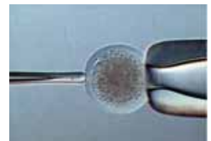
卵子透明帯の硬さ計測

ハプティック（触覚）技術による質感をセンサ及び計測システムを利用して定量的に評価する新しい診断技術の開発、超音波と位相シフト法の技術を融合化して細胞や卵子の特性を画像化する新しい計測技術の開発およびハプティック機能を持つやさしくやわらかい次世代ロボットハンド・アームの開発と医療支援システムへの応用を目指し、平成17年度に医療機器の実用化に向けたプラットフォーム形成を行い、平成18年度から都市エリア産学官連携促進事業（発展型）へ展開した。