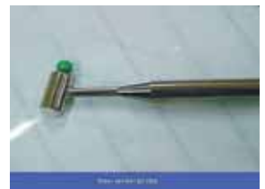
外科手術支援用触診プローブ

一般に、肝臓手術や動脈血管のバイパス手術を行う臨床現場では、手で患部に触れながら硬さ・軟らかさを診断するが、これまで定量的に評価することは困難であった。さらに、近年の内視鏡下手術の普及により、直接手で触れることさえも困難になっている。このため、触覚による質感をセンサ及び計測システムを利用して定量的に評価するハプティック技術の開発が臨床現場で求められていた。そこで、都市エリア事業（一般型）により位相シフト法を用いた触診に近い特性を持つ触覚センサの開発を行い、動物実験により臓器の病変部の硬さがリアルタイムで画像化できることを確認した。今後、臨床試験を進め実用化を目指す予定である。