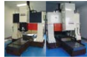
摩擦攪拌接合装置

Cooperation for Innovative Technology and Advanced Research in Evolutional Area (CITY AREA)