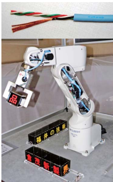
試作ケーブルと実装ロボット

■高容量で高信頼性リチウム電池用正極材料を開発 大容量で高出力特性を有するリチウムイオン二次電池正極材料をベースに、表面改質技術を研究して熱安定性を高めた正極材料を開発した。さらに、その正極材料を用いた電池を試作・評価し、表面処理が電池の安全性向上に効果があることを確認した。