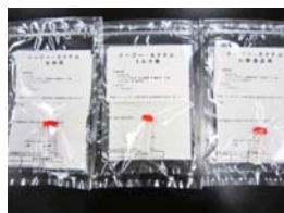
食中毒菌の網羅的迅速検査試薬「カクテルプライマー」