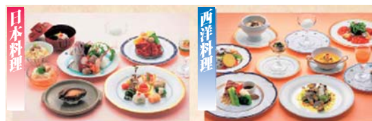
医療観光で提供されるヘルシーメニュー例 (徳島県栄養士会のサポートした 650kcal以下のメニュー)

徳島地域では、糖尿病克服を目指し糖尿病や合併症予防のための研究開発を行っている。そして、そこで生まれた成果を事業化し、社会に還元している。