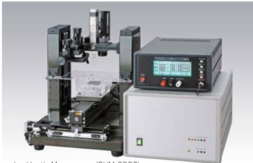
Scanning Haptic Macroscope (SHM-3000)