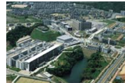
北九州地域: 北九州学術研究都市 産学連携センター(1~4号館)