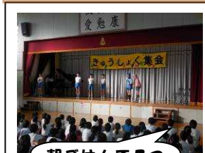
朝ごはんを3つのスイッチONにしよう!!