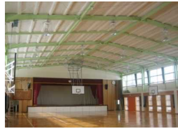
天井撤去後、ノンフロン湿式不燃断材を吹付（現場発泡ウレタン下地）