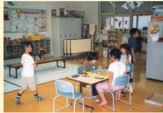
かづのしはちまんたい 鹿角市八幡平児童クラブ 鹿角市立八幡平小学校内（秋田県）