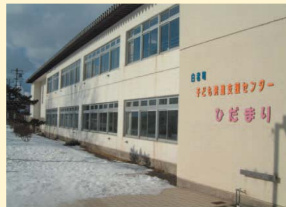
しらおいちよう 白老町子ども発達支援センターひだまり 白老町立萩野小学校内（北海道）