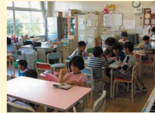
たかね 八王子市高嶺小学校学童保育所（東京都）

八王子市では、「一小学校区一学童保育所」を目標として、子育てをしやすい地域の環境を整えています。