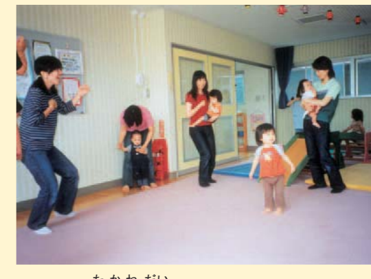
たかねだい 船橋市高根台子育て支援センター 船橋市立高根台第一小学校内（千葉県）

子育てに悩む保護者を支援するとともに、子どもの心身発達を促すための施設として活用されています。