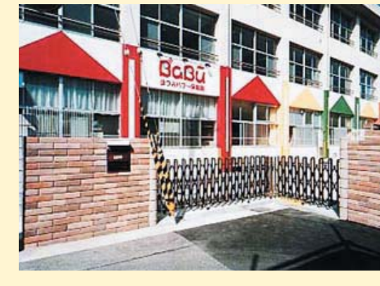
ほづみバブー保育園 豊中市立豊島小学校内（大阪府）