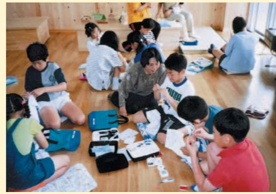
横浜市立矢向小学校（神奈川県）