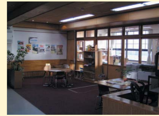
みはる 三春町立三春中学校（福島県）

余裕教室を学習情報センターや多目的教室として活用し、複数クラスでの授業や地域との交流が活発に行われています。