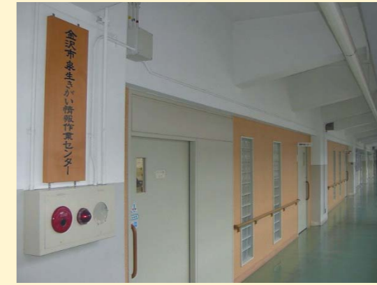
金沢市生きがい情報作業センター 金沢市立泉中学校内（石川県）

福祉・学習コミュニティの形成と学社融合を推進する地域福祉の拠点として活用されています。