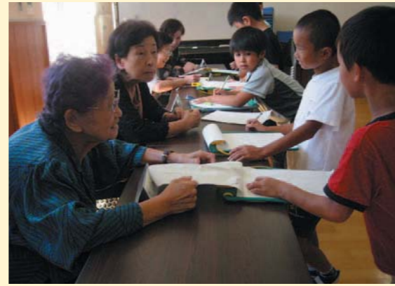
松山市生きがい交流センターしみず 松山市立清水小学校内（愛媛県）