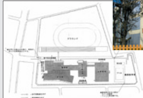
▲人と車の動線配置図