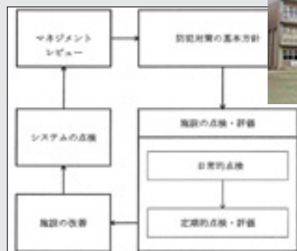
▲防犯マネジメントシステム概念図